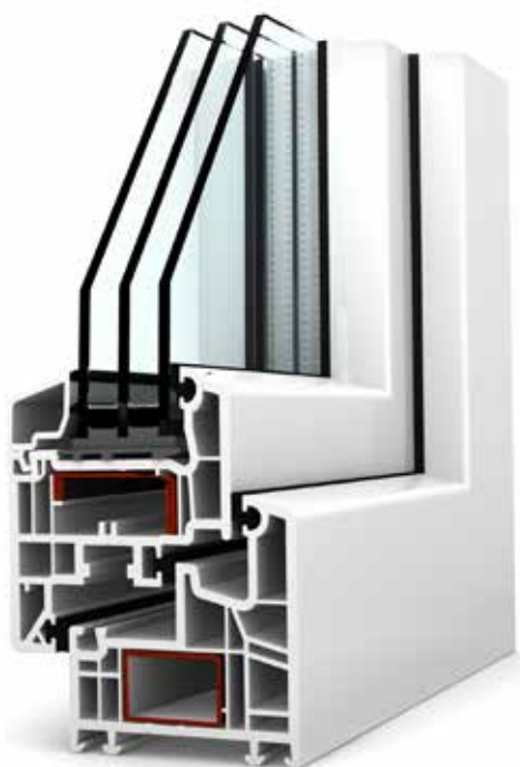
SOFTLINE70 CLASSIC mit 3-fach-Verglasung

WÄRMEDÄMMUNG U_w -WERT 0,87 W/m 2 K U_g -WERT 0,6 W/m 2 K mit Kunststoff Abstandhalter